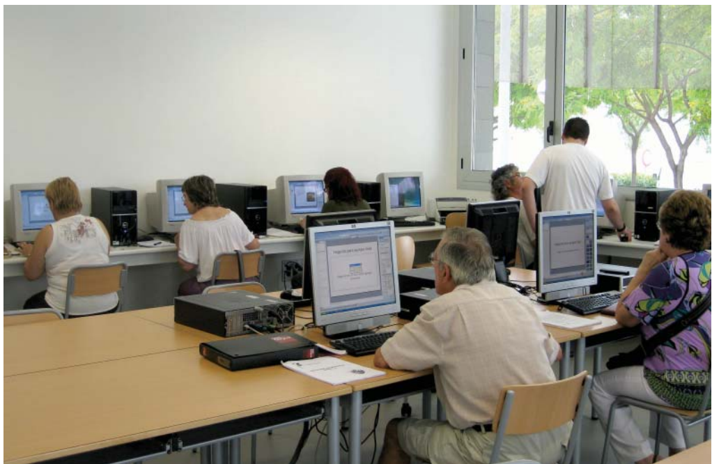
Los cursos de informática han dado formación en internet a las entidades

En los barrios de Ponent hay en marcha diferentes actividades y programas para la dinamización social y cultural y para el fomento del asociacionismo. El proyecto de cortometrajes sobre la vida en el barrio a cargo de alumnos de primaria del CEIP Doctor Fleming, la creación de una televisión por internet o los cursos de informática para asociaciones y entidades son algunas de las iniciativas dirigidas a promover la participación ciudadana y la cohesión social. Además, este verano se ha puesto en marcha, por primera vez, un casal para niños de 3 a 12 años.