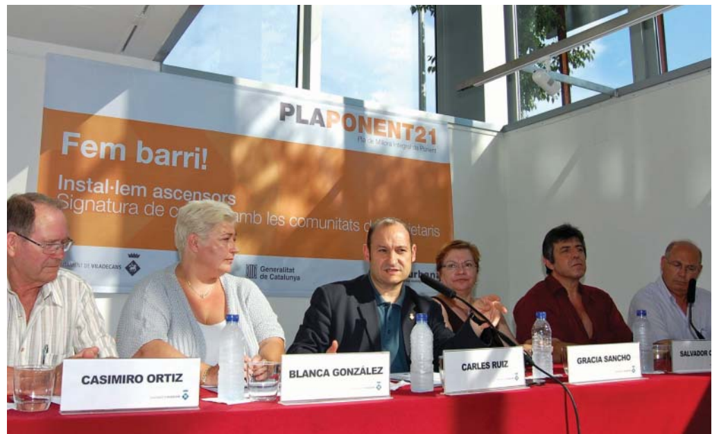
El 2 de julio se firmaron los contratos con cuatro comunidades de Hispanitat

Cinco comunidades de propietarios ya se han adherido al programa de instalación de ascensores del Pla de Millora Integral de Ponent. Vecinos de Can Batllori y de Hispanitat trabajan para hacer realidad una infraestructura que mejorará la accesibilidad a sus viviendas. Una vez firmados los contratos, se redactará el proyecto del ascensor, cuyas obras duran unos diez meses. A través del Pla de Barris se ofrecen ayudas para instalar ascensores de las que se pueden beneficiar 70 edificios de Poblat Roca, Hispanitat y Can Batllori.