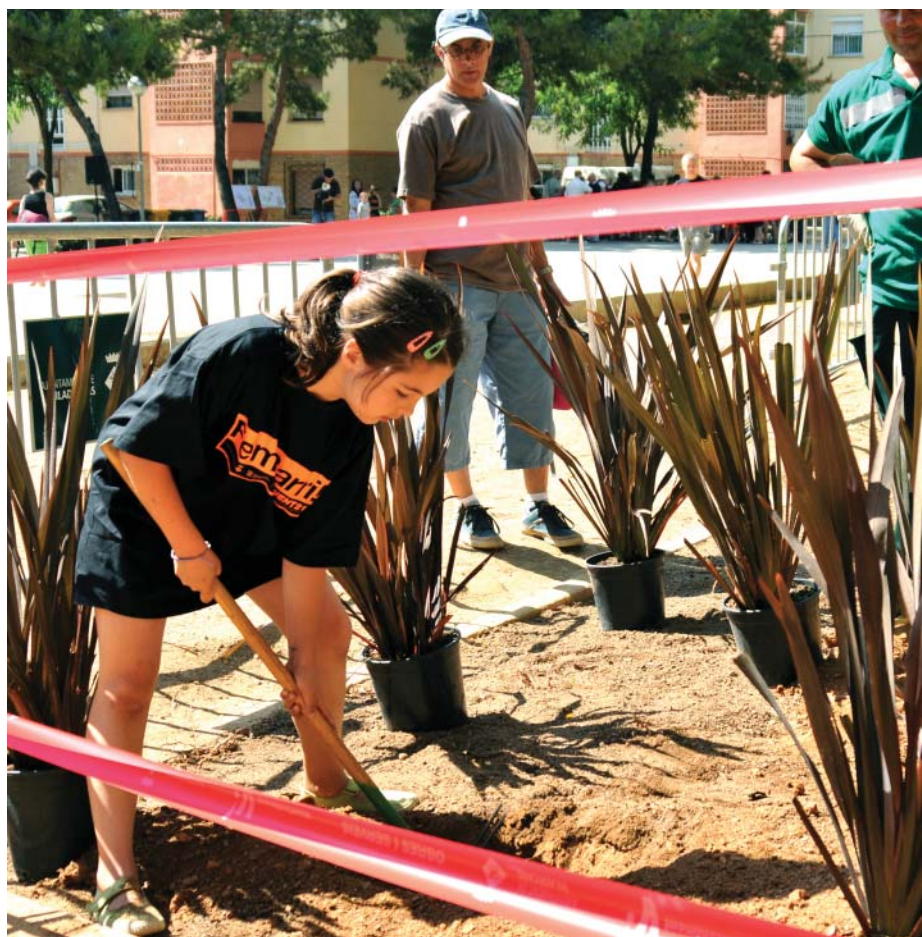
Los niños y niñas disfrutaron de una jornada festiva en la que conocieron su futuro barrio

El alcalde de Viladecans, Carles Ruiz, fue uno de los asistentes. Paseó por la plaza y departió con varios vecinos, que le hicieron llegar sus peticiones. El alcalde tomó nota: "El proyecto no es de la administración, lo estamos haciendo gracias a la participación de los vecinos", afirmó.