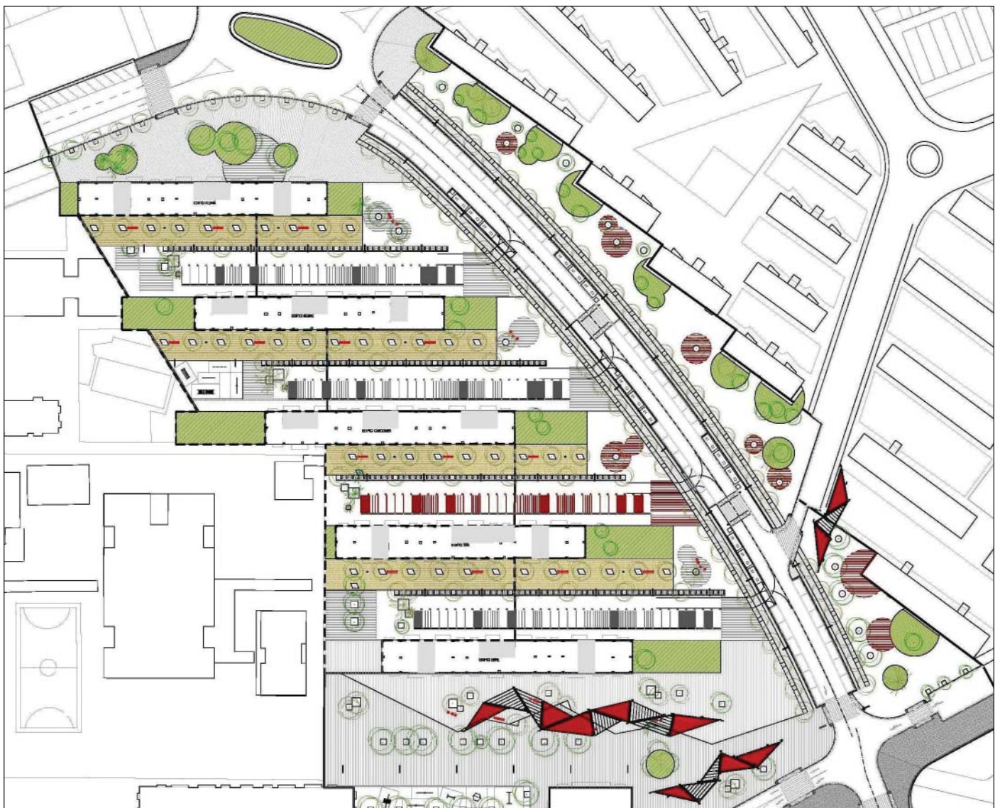
El proyecto abarca el tramo de la avenida del Doctor Fleming entre las avenidas de Gavà y de Lluís Moré del Castillo

una mejor conectividad. El proyecto abarca el tramo de la avenida del Doctor Fleming entre las avenidas de Lluís Moré del Castillo y de Gavà así como los espacios entre los bloques de Can Palmer. Una zona de más de 31.000 metros cuadrados de superficie que se renovará por completo.