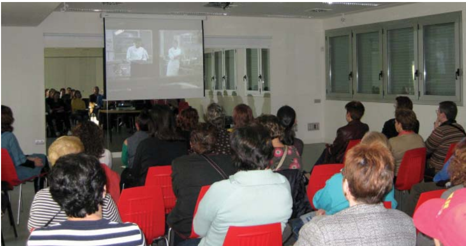
La projecció d'una pel·lícula va permetre reflexionar sobre els estereotips de gènere

Promoure la igualtat de gènere i debatre sobre temes que afecten el col·lectiu femení, aquests són els objectius del cicle Dones de Ponent que s'ha organitzat entre els mesos de març i de juny. A través de tallers i xerrades, desenes de persones han pogut reflexionar sobre el paper de la dona a la societat i els estereotips que encara l'envolten.