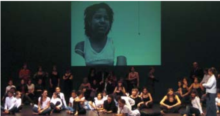
Els participants van poder expressar els seus somnis mitjançant l'expressió corporal

Una seixantena de veïns i veïnes de Viladecans van poder fer realitat el somni d'actuar a l'Atrium. Va ser el 22 de novembre en un espectacle de dansa contemporània que va comptar amb la participació d'un bon grapat de gent del sector de Ponent, molts dels quals pujaven per primer cop a un escenari teatral. L'estrena a l'Atrium va ser un èxit rotund.