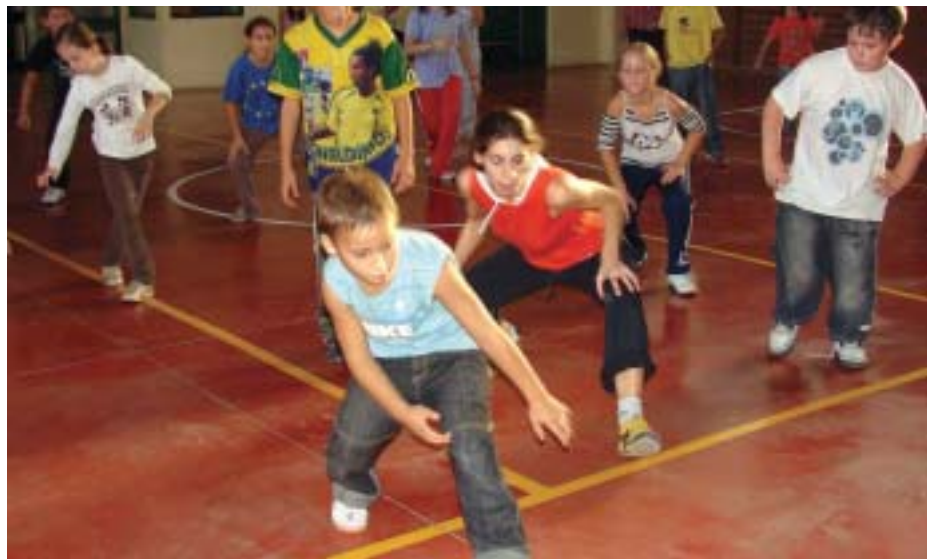
El Ateneu acogerá cursos de formación dirigidos a todas las edades

Durante el segundo trimestre de este año el Ayuntamiento dispondrá ya del programa funcional del Ateneu de les Arts, un documento que definirá sus características en cuanto a espacios y funcionamiento. El plan planteará la creación en los barrios de Ponent de un centro para la formación y sensibilización artística dirigido a toda la ciudadanía. El Ateneu ofrecerá propuestas en artes visuales, plásticas, escénicas y musicales.