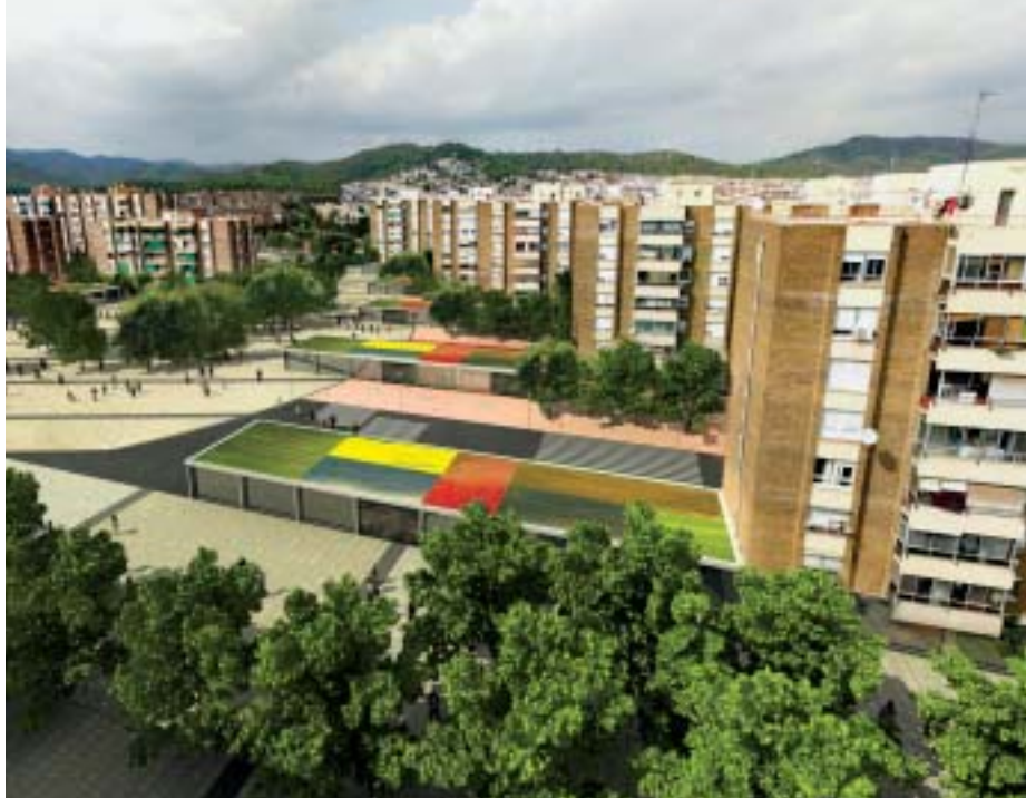
Can Palmer contará con una gran plaza con zonas verdes y espacios de descanso

otras ubicaciones alternativas que se activarán en función de la demanda de plazas existente y de la opinión de los vecinos del sector. Los posibles emplazamientos están situados en la avenida de Lluís Moré, en el campo de fútbol de Can Sellarés y en la futura plaza de Can Sellarés-Can Palmer.