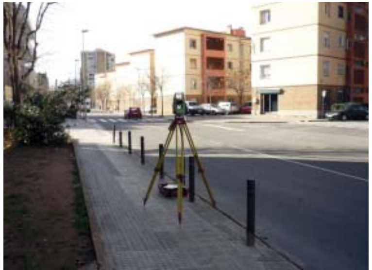
Levantamiento topográfico de los registros de Poblat Roca e Hispanitat

El Pla de Barris ha encargado un estudio para la reforma del alcantarillado de Poblat Roca e Hispanitat. La red actual está deteriorada y genera problemas de mantenimiento, por lo que hay que reformarla en profundidad. Las obras darán comienzo en otoño de 2009.