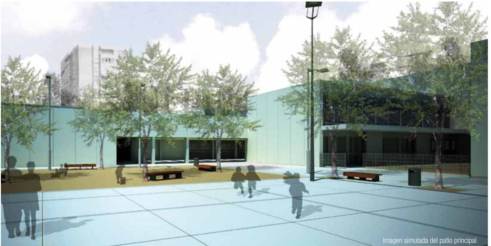
Imagen simulada del patio principal

El edificio de la nueva escuela, situado en la confluencia de la calle Remolar y la avenida Gavà , contará con planta baja y dos de altura, en las que se distribuirán más de 40 aulas, un gimnasio con vestuarios, un comedor con cocina propia, una biblioteca y un local para la asociación de madres y padres. El amplio patio tendrá espacios separados e independientes para los alumnos de infantil y primaria.