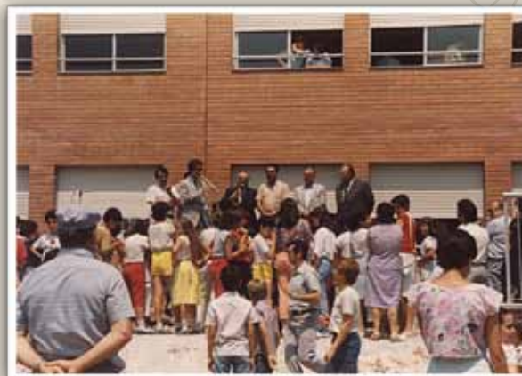
A l'esquerra, notícia del Butlletí de Viladecans, d'octubre del 1985, on es mostra el curs de les obres del nou centre escolar. A la dreta, fotografia de l'acte d'inauguració de l'escola, realitzada el 14 de juny de l'any 1986.