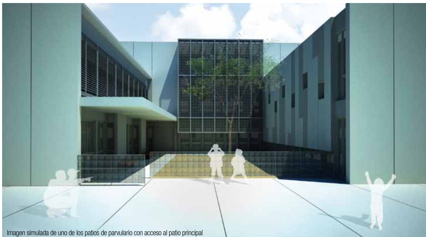
Imagen simulada de uno de los patios de parvulario con acceso al patio principal

Este mes arrancan las obras de la nueva escuela de educación infantil y primaria de Ponent, un importante equipamiento que contribuye a la transformación de la zona. El centro educativo impartirá clases a los niños y niñas de la zona de Ponent, entre ellos los que ahora deben desplazarse provisionalmente fuera del barrio hasta la escuela Viladecans IV.