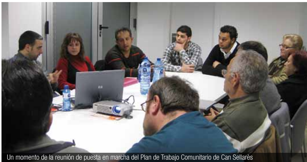
Un momento de la reunión de puesta en marcha del Plan de Trabajo Comunitario de Can Sellarès

Este plan, que promueve una mejor calidad de vida para el barrio, da continuidad al trabajo iniciado desde el Servicio de Apoyo a las Comunidades de Vecinos y Vecinas de la Llei de Barris. Y, como éste, requiere de la imprescindible implicación y compromiso de todos los habitantes del barrio para que el civismo y la convivencia se impongan.