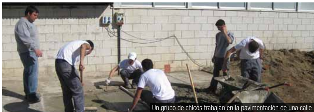
Un grupo de chicos trabajan en la pavimentación de una calle

Los barrios de Ponent cuentan este año con nuevas actuaciones para favorecer el acceso de las personas al mercado de trabajo. El programa 'T treball als barris', impulsado por la Generalitat de Catalunya como complemento a las actuaciones de la Llei de Barris, ha proporcionado este año un empleo a 38 vecinos y vecinas.